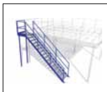
Trappa med avstigningsplan