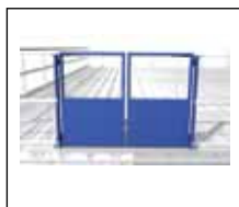
Självstängande grind med slitplåt. Bredd 1500 mm.