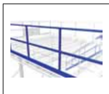
Räcke med sparkplåt