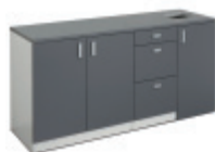
2b GRÅ | GREY | GRIS | GRAU E31816 + E31817 + 2 x E31802 + 2 x E31821 + E31807 (1832 x 635 mm bänkskiva | work top | plan de travail | Arbeitsplatte)