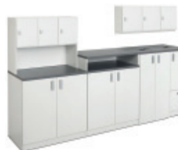
16a VIT | WHITE | BLANC | WEISS 2 x E31800 + E31808 (1832 mm bänkskiva | work top | plan de travail | Arbeitsplatte) + E31815 + E31812 + E31804 + E31802 + 2 x E31820