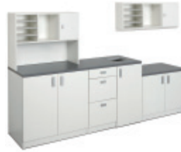
14a VIT | WHITE | BLANC | WEISS E31800 + E31801 + E31807 (1832 mm bänkskiva | work top | plan de travail | Arbeitsplatte) + E31811 + E31806 (916 mm bänkskiva | work top | plan de travail | Arbeitsplatte) + E31804 + E31802 + 2 x E31814 + 2 x E31803