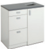
E31801 Recycling 900 VIT | WHITE | BLANC | WEISS 928 x 916 x 635