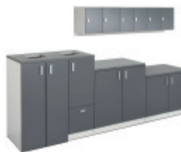
11b GRÅ | GREY | GRIS | GRAU E31818 + E31816 + E31819 + 2 x E31806 (926 mm bänkskiva | work top | plan de travail | Arbeitsplatte) + 2 x E31802 + 2 x E31821