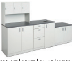
13a VIT | WHITE | BLANC | WEISS E31800 + E31801 + E31807 (1832 mm bänkskiva | work top | plan de travail | Arbeitsplatte) + E31811 + E31806 (916 mm bänkskiva | work top | plan de travail | Arbeitsplatte) + E31804 + E31820