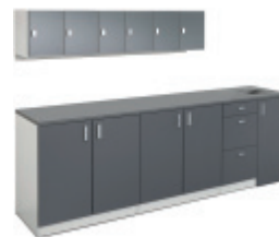
17b GRÅ | GREY | GRIS | GRAU 2 x E31816 + E31817 + E31809 (2748 mm bänkskiva | work top | plan de travail | Arbeitsplatte) + E31819 + E31806 (916 mm bänkskiva | work top | plan de travail | Arbeitsplatte) + 2 x E31802 + 2 x E31821