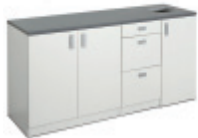
1a VIT | WHITE | BLANC | WEISS E31800 + E31801 + E31807 (1832 x 635 mm bänkskiva | work top | plan de travail | Arbeitsplatte)

2 skåp | 2 cabinets | 2 meubles | 2 Schränke B | W | L | B 1832 mm