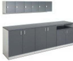
9b GRÅ | GREY | GRIS | GRAU 2 x E31816 + E31808 (1832 mm bänkskiva | work top | plan de travail | Arbeitsplatte) + E31819 + E31806 (916 mm bänkskiva | work top | plan de travail | Arbeitsplatte) + E31812 + 2 x E31802 + 2 x E31821