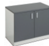
E31819 Golvskåp | Floor standing cabinet | Meuble bas | Bodenschrank 700 GRÅ | GREY | GRIS | GRAU 728 x 916 x 635