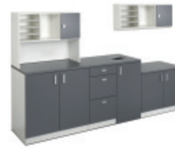
14b GRÅ | GREY | GRIS | GRAU E31816 + E31817 + E31807 (1832 mm bänkskiva | work top | plan de travail | Arbeitsplatte) + E31819 + E31806 (916 mm bänkskiva | work top | plan de travail | Arbeitsplatte) + E31804 + E31802 + 2 x E31814 + 2 x E31813