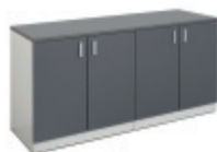
3b GRÅ | GREY | GRIS | GRAU 2 x E31816 + 2 x E31802 + 2 x E31821 + E31808 (1832 x 635 mm bänkskiva | work top | plan de travail | Arbeitsplatte)