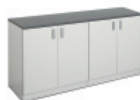
8a VIT | WHITE | BLANC | WEISS 2 x E31800 + E31808 (1832 x 625 mm bänkskiva | work top | plan de travail | Arbeitsplatte) + E31811 + E31806 (916 x 625 mm bänkskiva | work top | plan de travail | Arbeitsplatte) + 2 x E31802 + 2 x E31820