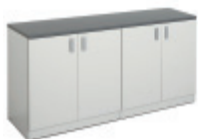
3a VIT | WHITE | BLANC | WEISS 2 x E31800 + 2 x E31802 + 2 x E31820 + E31808 (1832 x 635 mm bänkskiva | work top | plan de travail | Arbeitsplatte)