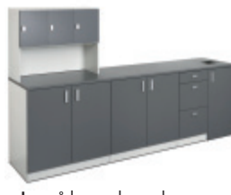
12b GRÅ | GREY | GRIS | GRAU 2 x E31816 + E31817 + E31809 (2748 mm bänkskiva | work top | plan de travail | Arbeitsplatte) + E31804 + E31821