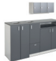
7b GRÅ | GREY | GRIS | GRAU E31818 + E31816 + E31806 (916 x 625 mm bänkskiva | work top | plan de travail | Arbeitsplatte) + E31812 + E31802 + E31821

3 skåp | 3 cabinets | 3 meubles | 3 Schränke B | W | L | B 2748 mm