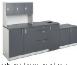
13b GRÅ | GREY | GRIS | GRAU E31816 + E31817 + E31807 (1832 mm bänkskiva | work top | plan de travail | Arbeitsplatte) + E31819 + E31806 (916 mm bänkskiva | work top | plan de travail | Arbeitsplatte) + E31804 + E31821