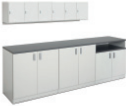
9a VIT | WHITE | BLANC | WEISS 2 x E31800 + E31808 (1832 mm bänkskiva | work top | plan de travail | Arbeitsplatte) + E31811 + E31806 (916 mm bänkskiva | work top | plan de travail | Arbeitsplatte) + E31812 + 2 x E31802 + 2 x E31820