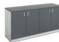
8b GRÅ | GREY | GRIS | GRAU 2 x E31816 + E31808 (1832 x 625 mm bänkskiva | work top | plan de travail | Arbeitsplatte) + E31819 + E31806 (916 x 625 mm bänkskiva | work top | plan de travail | Arbeitsplatte) + 2 x E31802 + 2 x E31821