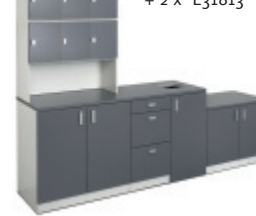
15b GRÅ | GREY | GRIS | GRAU E31816 + E31817 + E31807 (1832 mm bänkskiva | work top | plan de travail | Arbeitsplatte) + E31819 + E31806 (915 mm bänkskiva | work top | plan de travail | Arbeitsplatte) + E31804 + E31802 + 2 x E31821