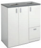
E31815 Recycling 1100 VIT | WHITE | BLANC | WEISS 1128 x 1038 x 635