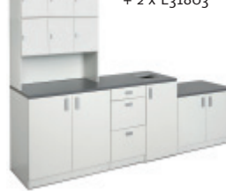
15a VIT | WHITE | BLANC | WEISS E31800 + E31801 + E31807 (1832 mm bänkskiva | work top | plan de travail | Arbeitsplatte) + E31811 + E31806 (915 mm bänkskiva | work top | plan de travail | Arbeitsplatte) + E31804 + E31802 + 2 x E31820