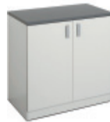
E31800 Golvskåp | Floor standing cabinet | Meuble bas | Bodenschrank 900 VIT | WHITE | BLANC | WEISS 928 x 916 x 635