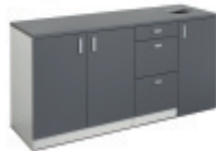
1b GRÅ | GREY | GRIS | GRAU E31816 + E31817 + E31807 (1832 x 635 mm bänkskiva | work top | plan de travail | Arbeitsplatte)