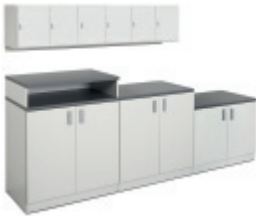
10a VIT | WHITE | BLANC | WEISS 2 x E31800 + E31808 (1832 mm bänkskiva | work top | plan de travail | Arbeitsplatte) + E31811 + E31806 (916 mm bänkskiva | work top | plan de travail | Arbeitsplatte) + E31812 + 2 x E31802 + 2 x E31820