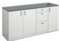
2a VIT | WHITE | BLANC | WEISS E31800 + E31801 + 2 x E31802 + 2 x E31820 + E31807 (1832 x 635 mm bänkskiva | work top | plan de travail | Arbeitsplatte)