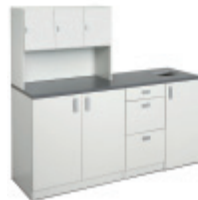
5a VIT | WHITE | BLANC | WEISS E31800 + E31801 + E31804 + E31820 + E31807 (1832 x 635 mm bänkskiva | work top | plan de travail | Arbeitsplatte)