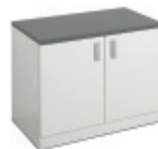
E31811 Golvskåp | Floor standing cabinet | Meuble bas | Bodenschrank 700 VIT | WHITE | BLANC | WEISS 728 x 916 x 635