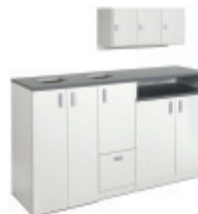
7a VIT | WHITE | BLANC | WEISS E31815 + E31800 + E31806 (916 x 625 mm bänkskiva | work top | plan de travail | Arbeitsplatte) + E31812 + E31802 + E31820