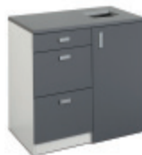
E31817 Recycling 900 GRÅ | GREY | GRIS | GRAU 928 x 916 x 635