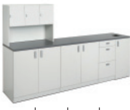
12a VIT | WHITE | BLANC | WEISS 2 x E31800 + E31801 + E31809 (2748 mm bänkskiva | work top | plan de travail | Arbeitsplatte) + E31804 + E31820