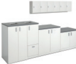
11a VIT | WHITE | BLANC | WEISS E31815 + E31800 + E31811 + 2 x E31806 (926 mm bänkskiva | work top | plan de travail | Arbeitsplatte) + 2 x E31802 + 2 x E31820