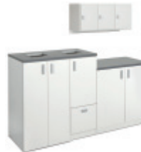
6a VIT | WHITE | BLANC | WEISS E31815 + E31800 + E31806 (916 x 625 mm bänkskiva | work top | plan de travail | Arbeitsplatte) + E31802 + E31820