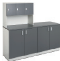
4b GRÅ | GREY | GRIS | GRAU 2 x E31816 + E31804 + E31821 + E31808 (1832 x 635 mm bänkskiva | work top | plan de travail | Arbeitsplatte)