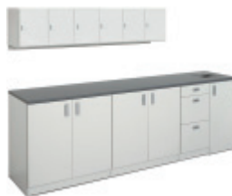
17a VIT | WHITE | BLANC | WEISS 2 x E31800 + E31801 + E31809 (2748 mm bänkskiva | work top | plan de travail | Arbeitsplatte) + E31811 + E31806 (916 mm bänkskiva | work top | plan de travail | Arbeitsplatte) + 2 x E31802 + 2 x E31820

4 skåp | 4 cabinets | 4 meubles | 4 Schränke B | W | L | B 3664 mm