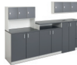
16b GRÅ | GREY | GRIS | GRAU 2 x E31816 + E31808 (1832 mm bänkskiva | work top | plan de travail | Arbeitsplatte) + E31818 + E31812 + E31804 + E31802 + 2 x E31821

4 skåp | 4 cabinets | 4 meubles | 4 Schränke B | W | L | B 3664 mm