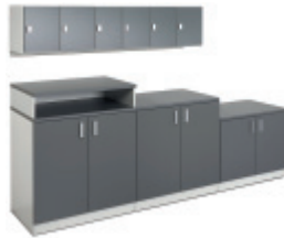
10b GRÅ | GREY | GRIS | GRAU 2 x E31816 + E31808 (1832 mm bänkskiva | work top | plan de travail | Arbeitsplatte) + E31819 + E31806 (916 mm bänkskiva | work top | plan de travail | Arbeitsplatte) + E31812 + 2 x E31802 + 2 x E31821