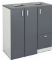
E31818 Recycling 1100 GRÅ | GREY | GRIS | GRAU 1128 x 1038 x 635