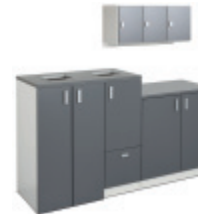
6b GRÅ | GREY | GRIS | GRAU E31818 + E31816 + E31806 (916 x 625 mm bänkskiva | work top | plan de travail | Arbeitsplatte) + E31802 + E31821