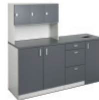
5b GRÅ | GREY | GRIS | GRAU E31816 + E31817 + E31804 + E31821 + E31807 (1832 x 625 mm bänkskiva | work top | plan de travail | Arbeitsplatte)