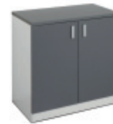
E31816 Golvskåp | Floor standing cabinet | Meuble bas | Bodenschrank 900 GRÅ | GREY | GRIS | GRAU 928 x 916 x 635