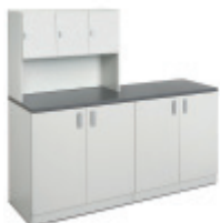
4a VIT | WHITE | BLANC | WEISS 2 x E31800 + E31804 + E31820 + E31808 (1832 x 635 mm bänkskiva | work top | plan de travail | Arbeitsplatte)